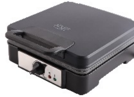
WAFFLE MAKER AD 3049