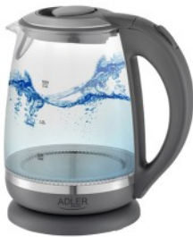
ELECTRIC KETTLE AD 1286