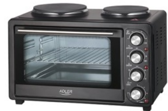
Electric Oven With HOB AD 6020