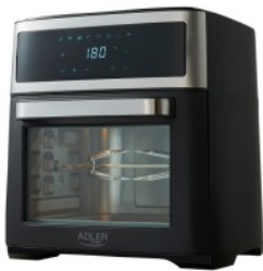
AIR FRYER OVEN AD 6309