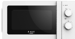
MICROWAVE OVEN AD 6205