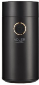
COFFEE GRINDER AD 4446