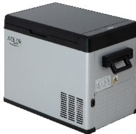
PORTABLE FRIDGE AD 8077