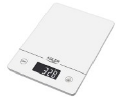
KITCHEN SCALE AD 3170