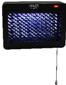
MOSQUITO LAMP AD 7938