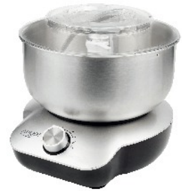
MIXER WITH BOWL AD 4222