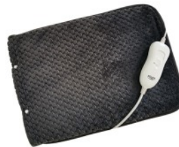
HEATED PAD AD 7433