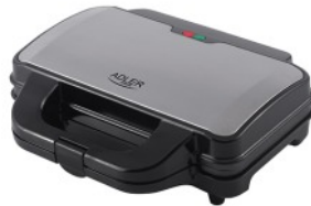
SANDWICH MAKER AD 3043