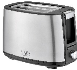
TOASTER 2 SLICE AD 3214