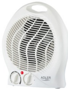
FAN HEATER AD 7728