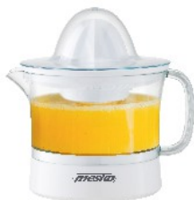
CITRUS JUICER MS 4010