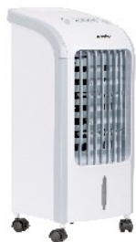
AIR COOLER MS 7914