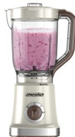
BLENDER WITH JAR MS 4079