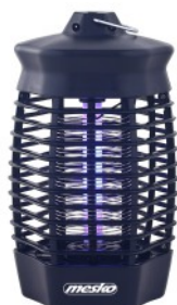
MOSQUITO KILLER LAMP MS 7933