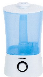
AIR HUMIDIFIER MS 7965