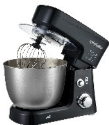
MIXER WITH BOWL MS 4217