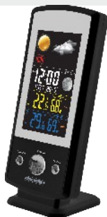
Weather Station MS 1177