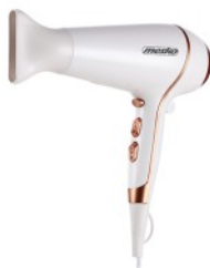
HAIR DRYER MS 2250