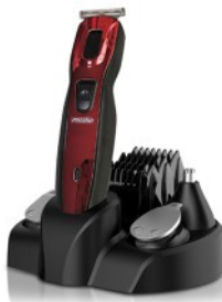
TRIMMER SET MS 2931