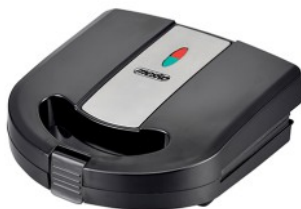
SANDWICH MAKER 3IN1 MS 3045