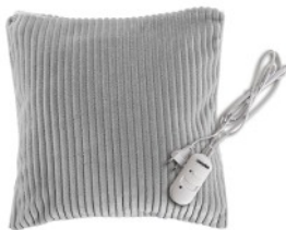
HEATED PAD MS 7429