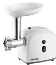
MEAT MINCER MS 4805