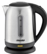
ELECTRIC KETTLE MS 1288