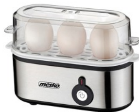
Egg Boiler MS 4485