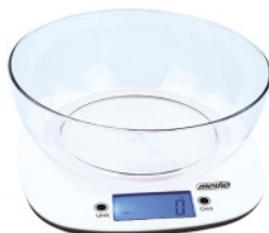
KITCHEN SCALE MS 3165